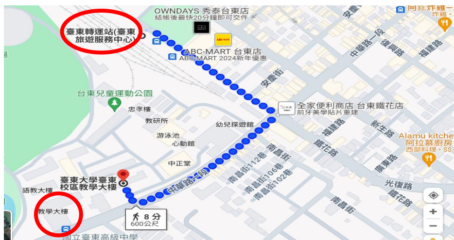
圖一 臺東轉運站至研習會場步行距離與時間評估圖