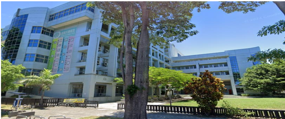
圖三 臺東大學臺東校區教學大樓實拍圖